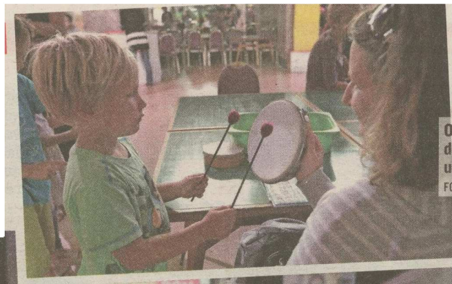
Otroci v Pionirskem domu razvijajo ustvarjalnost.