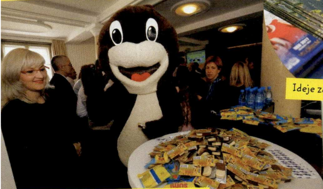
Ideje za počitnice v Nemčiji