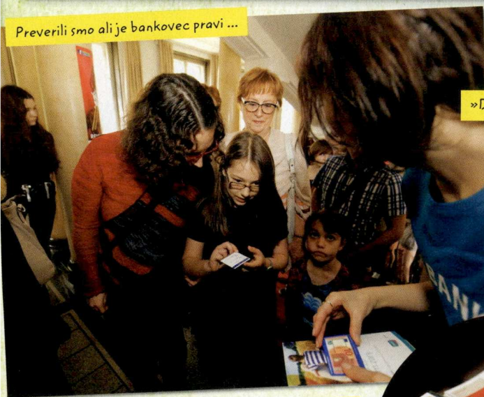
Preverili smo ali je bankovec pravi ...