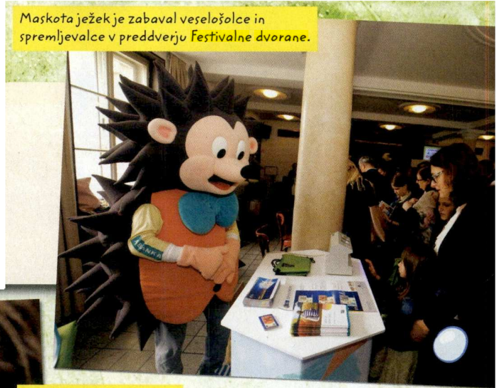
Maskota ježek je zabaval veselošolce in spremljevalce v preddverju Festivalne dvorane.