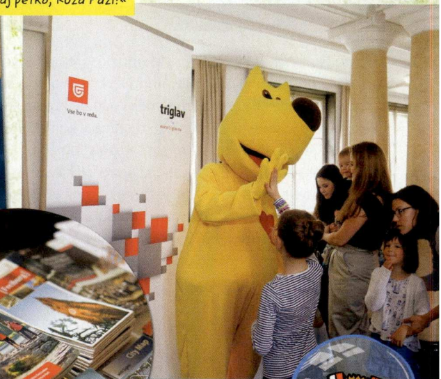
»Daj petko, Kuža Pazi!«