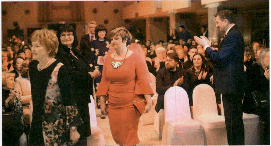
Onine ženske so požele spontane ovacije ob prihodu v Festivalno dvorano.