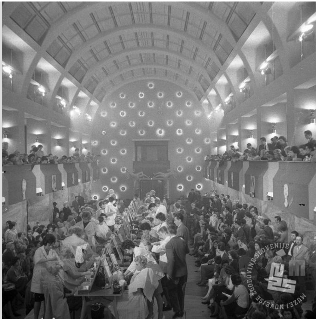
Tekmovanje frizerjev leta 1961 v Festivalni dvorani .