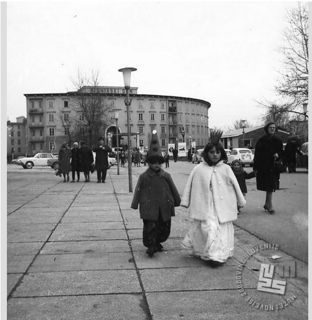
Pustovanje leta 1966.