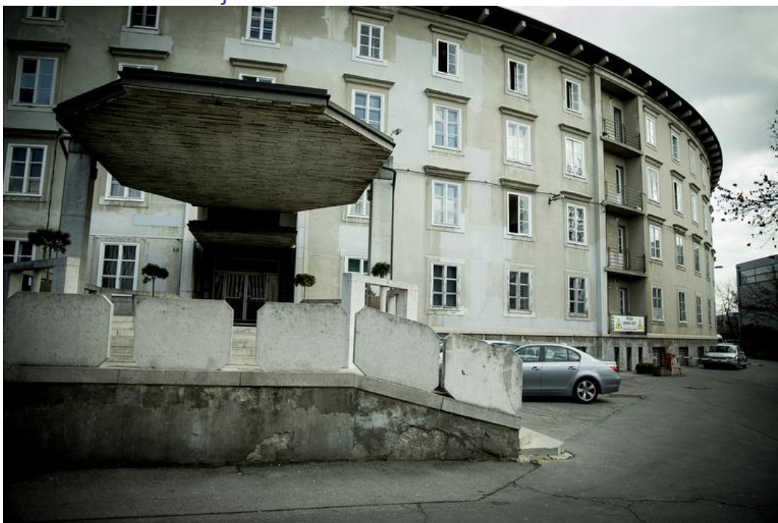
Foto: Polkrožno štirinadstropno stavbo za Bežigradom je Plečnik za semenišče zasnoval v krožni kompoziciji, vendar je to uresničitev prekinila druga svetovna vojna.

Baragovo semenišče je nastalo na opuščnem ljubljanskem pokopališču. Sprva so